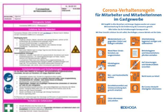
Abb. 2 Aushänge für Beschäftigte (Auswahl)

Außerdem wird durch Betriebsanweisungen und Aushänge in relevanten Sprachen an die Regeln erinnert (siehe Abb.2).