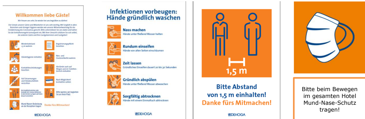
Abb. 1 Aushänge und Informationen für Gäste (Auswahl)